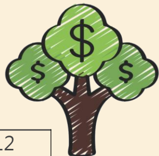
傳善獎三年實際計畫支出表